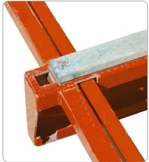
Slityta i rötskyddat trä.