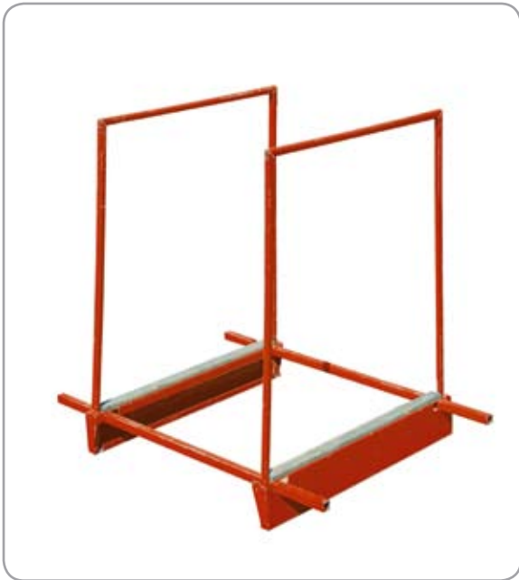
Stabil plåt- och rörkonstruktion.